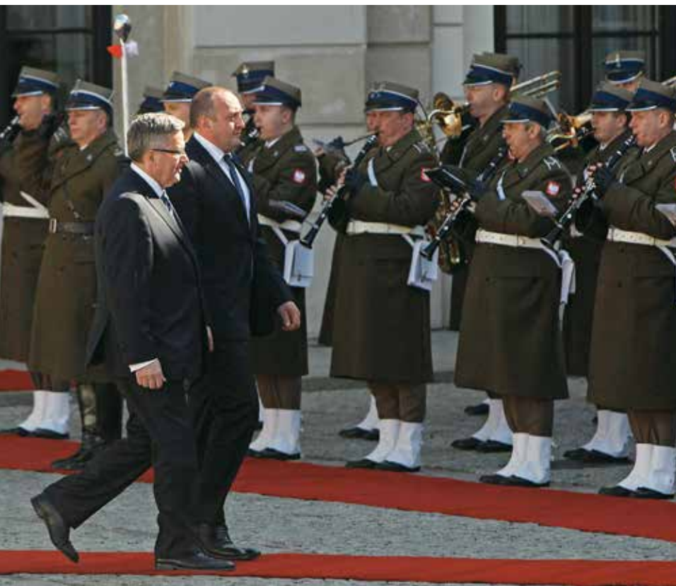
Президент Польши Бронислав Коморовский, слева, и его грузинский коллега Георгий Маргвелашвили проходят перед почетным караулом в Варшаве в апреле 2014 года. Президенты встретились для обсуждения вопросов региональной безопасности и экономического сотрудничества.

В 2011 году, Центр им. Маршалла провели два семинара для