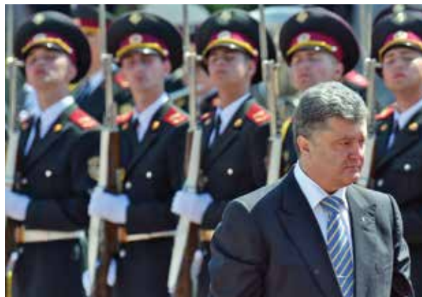
Президент Украины Петро Порошенко обходит строй почетного караула во время инаугурации в Киеве в июне 2014 г. Порошенко стал пятым президентом постсоветской Украины и поклялся объединить страну, несмотря на продолжающийся кризис отношений с Россией.

национального суверенитета означает вступить в конфликт с очень тяжелыми последствиями. Умиротворение – лишь приглашение к разворачиванию еще более масштабного и глубокого конфликта. 1