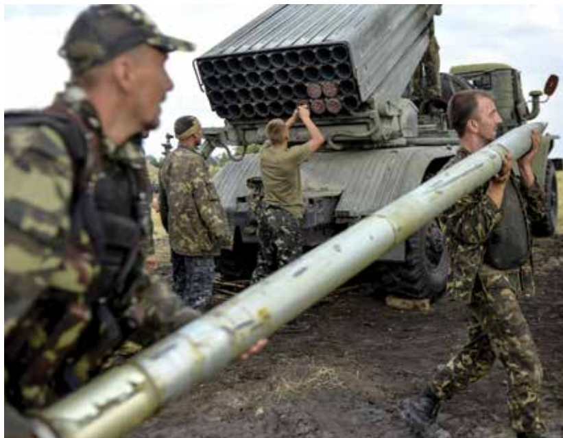
Украинские военнослужащие заряжают установку залпового огня «Град» в окрестностях города Счастье в августе 2014 г. Украина обвинила про-российских повстанцев в уничтожении десятков граждан, бегущих от конфликта на востоке страны.

Отношение Москвы к протестам, получившим название революции Евромайдана, рассматривается не только в контексте отказа Украины от политических и экономических инициатив России, но и на фоне того, что в России воспринимается широкими кругами населения как «уроки» распада Советского Союза. В