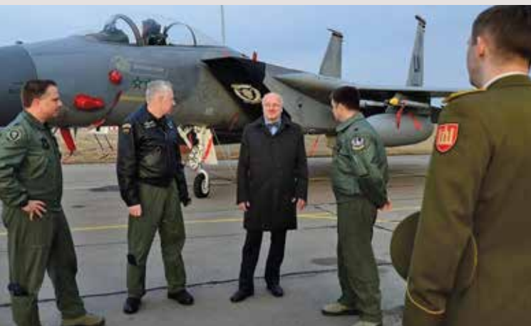
Министр обороны Литвы Юозас Олекас (в центре), осматривает самолет ВВС США F-15C «Орел» на авиабазе в Шяуляе (Литва), в марте 2014 г. Эти самолеты участвуют в миссии НАТО по патрулированию воздушного пространства стран Балтии.