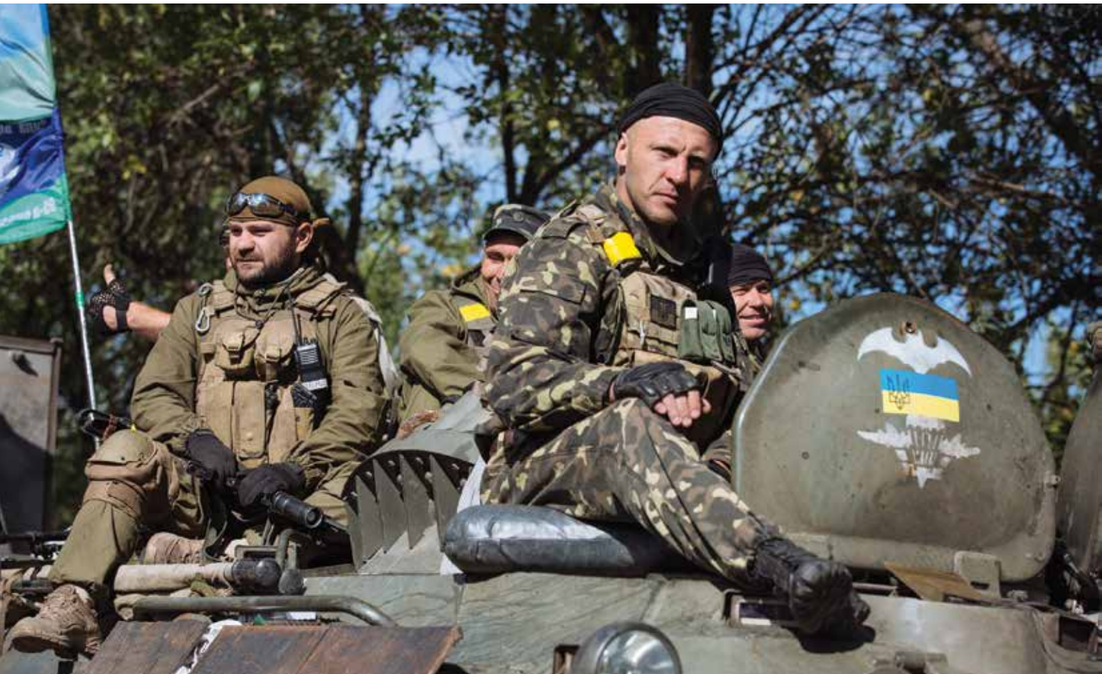
Украинские солдаты сидят на бронетранспортере в районе города Краматорска в сентябре 2014 г. во время конфликта с пророссийскими сепаратистами.

Так, например, нам известно, что такие государства, как Ирак и Афганистан, постоянно нуждаются в иностранной помощи для успешной борьбы с повстанцами. Несмотря на определенный прогресс, достигнутый благодаря военным кампаниям США, в указанных государствах сохраняется политическая нестабильность. Источником угрозы в них являются не только действия повстанцев и сепаратистов, равно как и межэтнические и межконфессиональные конфликты, но и также низкий уровень развития демократических институтов, слабые вооруженные силы и разведслужбы – все это на фоне повсеместной коррупции. По правде говоря, перед нами – несостоявшиеся государства.