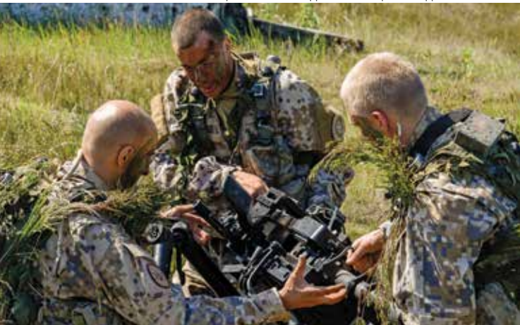
Войска стран Североатлантического союза участвуют в учениях НАТО «Удар саблей-2014» в Литве, Латвии и Эстонии. Около 4 700 военнослужащих из 10 стран приняли участие в учениях, проводившихся в июне 2014 г. с целью обеспечения региональной стабильности и многонациональной оперативной совместимости.