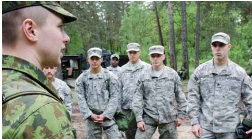
Военнослужащий механизированной бригады «Железный волк» (Литва) обучает американских десантников защите от химического, биологического, радиологического и ядерного оружия (май 2014 г.). Военнослужащие стран НАТО проходят совместную подготовку в Польше, Эстонии, Латвии и Литве для повышения оперативной совместимости.

повышения готовности и способности реагировать в невоенных областях: энергетика, кибер- и информационная безопасность. В 2013 году мы создали Центр энергетической безопасности, который стал Центром передового опыта НАТО, специализирующимся на вопросах оперативной энергетической безопасности. Помимо этого мы инвестируем в средства кибербезопасности. Департамент стратегических коммуникаций министерства обороны Литвы расследует кибернападения России против Литвы и оценивает потенциальные контрмеры. Государства Балтии договорились о координации стратегических коммуникаций для создания потенциала информационной войны.