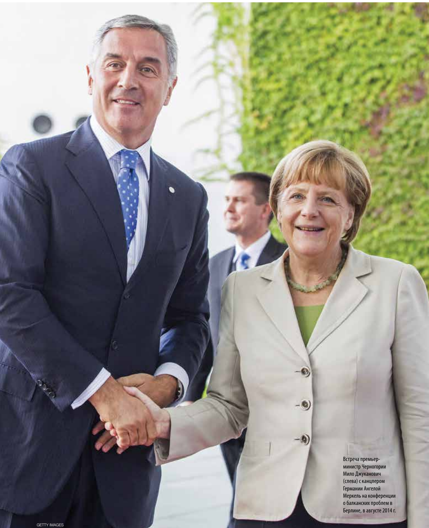
Встреча премьер-министра Черногории Мило Джуканович (слева) с канцлером Германии Ангелой Меркель на конференции о балканских проблемах в Берлине, в августе 2014 г.