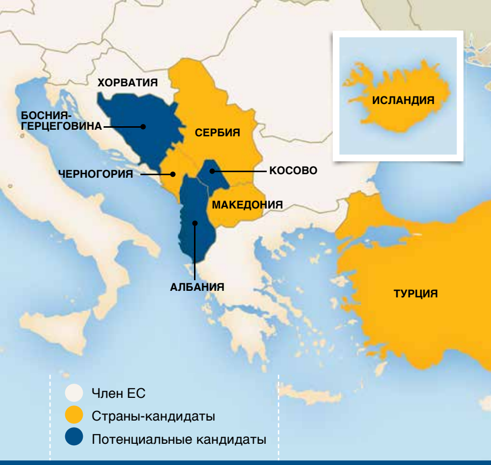
ИЛЛЮСТРАЦИЯ PER CONCORDIAM

озабоченность ЕС вызывает контроль внешних границ, мы намерены полностью обеспечить принятие новых законов о пограничном контроле, миграции, визах, предоставлении убежища, о сотрудничестве правоохранительных и судебных органов.