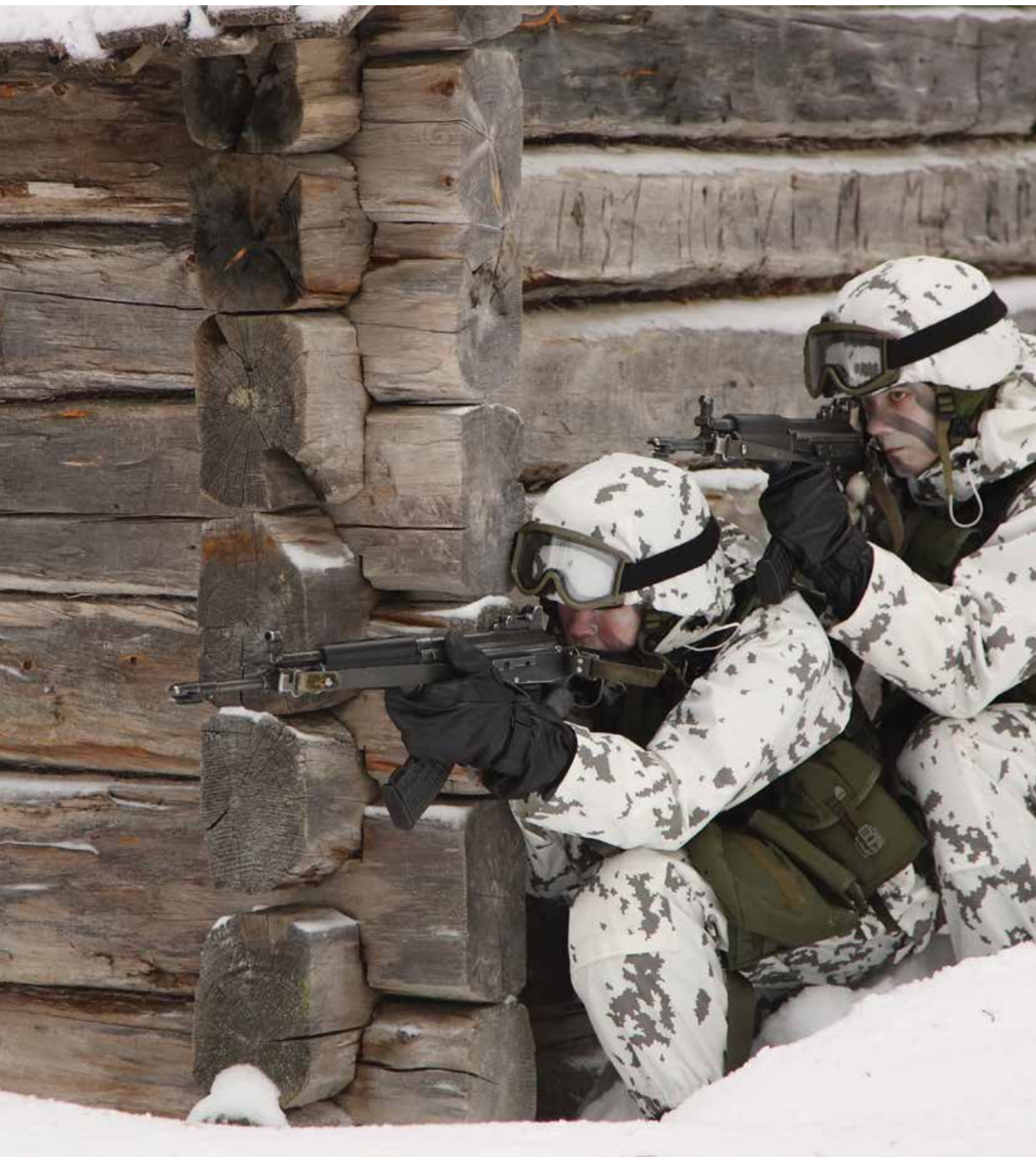
Зимняя подготовка сухопутных сил Финляндии. Силы обороны Финляндии