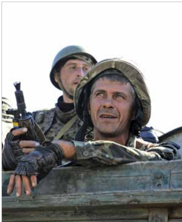
Август 2014 г.: украинские военнослужащие выдвигаются на боевой машине в направлении Новоозовска в Донецкой области. Украинские силы ведут боевые действия с сепаратистами, получающими вооружение и поддержку из России.

Особое значение для Путина имеет позиция Китая, и если недоброжелательное отношение Японии найдет отклик и у Китая, то ситуация может измениться