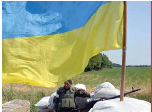
Украинский солдат на блок-посту неподалеку от восточного города Дебальцево в августе 2014 г., возле которого шли бои между правительственными силами и поддерживаемыми Москвой пророссийскими сепаратистами.

меморандуме, написанном Джорджем Кеннаном в 1946 году. Меморандум представлял собой документ, в котором трезво и убежденно были изложены основанные на реалистичных подходах политические предписания, но который при этом был полон уважения и восхищения перед достоинствами русской цивилизации. В журнале «Foreign Affairs» под псевдонимом «X» вышла статья,