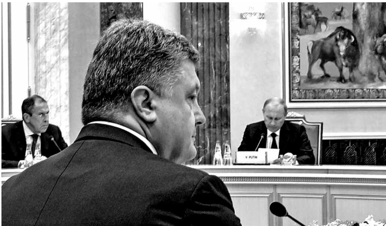
Президент Украины Петро Порошенко на саммите в Минске в августе 2014 г. Справа от него Президент России Владимир Путин, слева – министр иностранных дел РФ Сергей Лавров.

материалах доминанта специфически идеологизированной пропагандируемой идеи конкуренции с западными правительствами, особенно, с правительством США. Преобладающая тема сегодняшних публикаций в государственных СМИ сводится к тому, что западные правительства пытаются изолировать Россию, нанести ей поражение в целях расширения рынков сбыта и распространения своего культурного влияния на всю Евразию. Сегодня уровень ксенофобии в России исключительно высок; он превосходит уровень ксенофобии в последние два десятилетия существования СССР, страны и системы, известных своим страхом перед иностранцами. Но эта ксенофобия не является лишь характеристикой или рудиментом коммунизма — прецеденты такой ксенофобии имели место в российской истории. Россия запоздала с изменениями, происходившими в эпоху Ренессанса и просвещения, она, в основном, воспользовалась лишь ее отголосками. Европейскому либерализму всегда противостояли идеологические оппоненты, славянофилы, которые стремились защитить свои ценности от яростных нападков «западников».