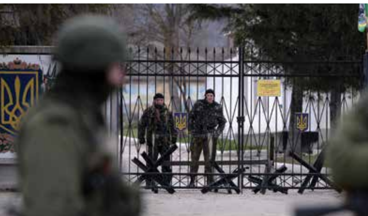
Украинские солдаты под Севастополем смотрят на российских солдат за воротами военной базы в марте 2014 года. Вооруженные российские войска в формах без знаков различия взяли в окружение украинские военные объекты по всему Крыму.

Одним из примеров служила непрекращающаяся вера у многих в числе русскоязычного населения Украины, что было запрещено использование русского языка. 23